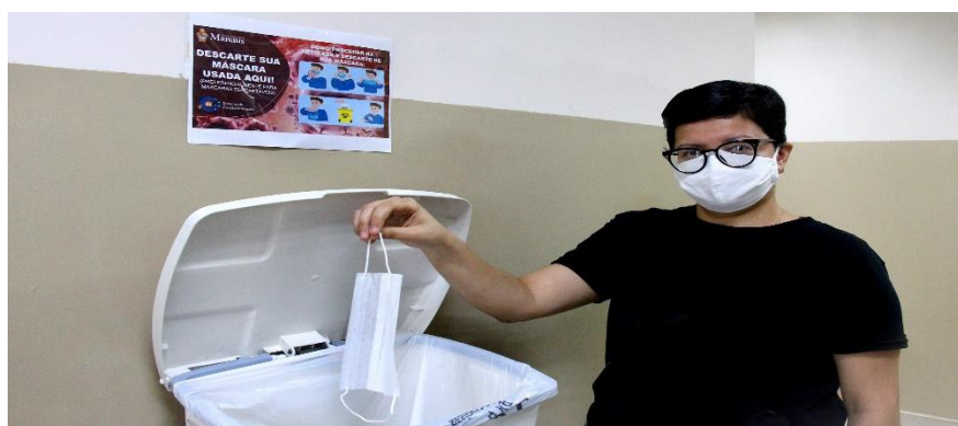
DESCARTE CORRETO DE MÁSCARAS DESCARTÁVEIS