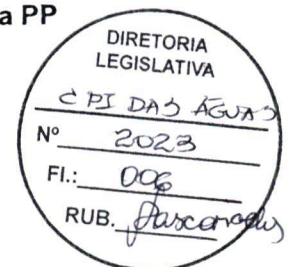
BESSA Vereador SDD

Rua Padre Agostinho Caballero Martin, 850 – São Raimundo Manaus – AM / CEP: 69027-020 Tel.: 3303-2864 www.cmm.am.gov.br